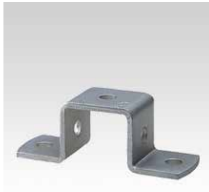
Для профиля 28/30 и 38/40