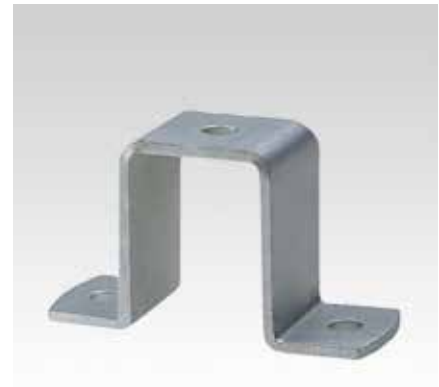
Для профиля 40/60, 40/80, 38/80 и 40/120