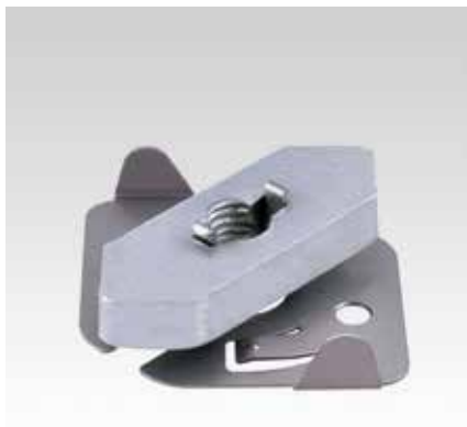
Для углового монтажа