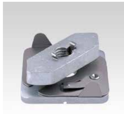
С внутренней резьбой