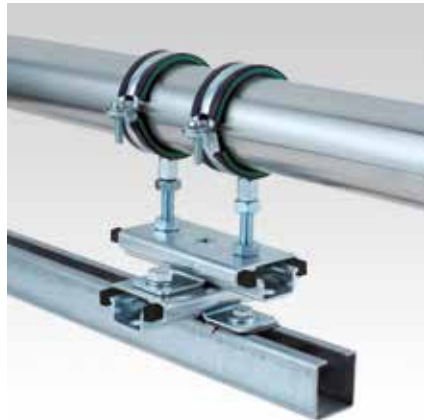
Монтаж двух ползунков крест-накрест, «стоя» на МРС-профиле