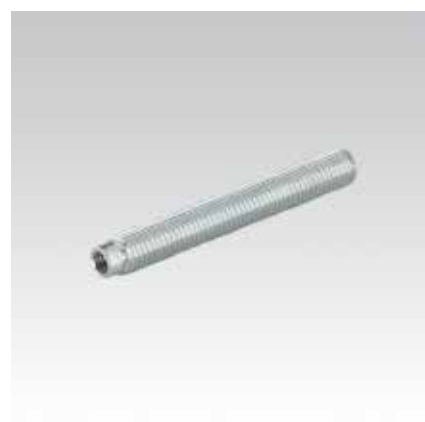
Анкерный стержень для полнотелого и пустотелого кирпича тип VMU-IG, класс прочности 5.8