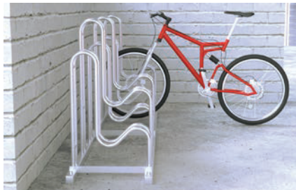
Стойки для велосипедов