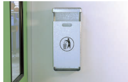
Почтовые ящики, мусорные баки